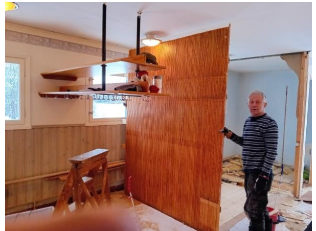
Den fina träpanelen i ett stycke.

Sevalla Hem- och Bygdegårdsförening Organisationsnummer: 878001-0115 sevallahemochbygdegard@gmail.com