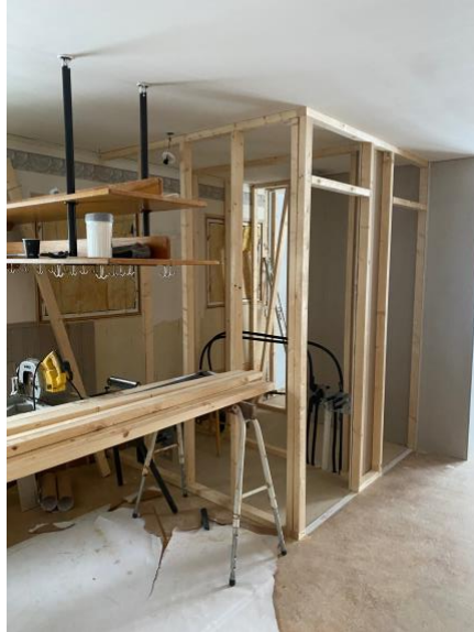
Vy över hallen och de nya toaletterna. 2024-01-13