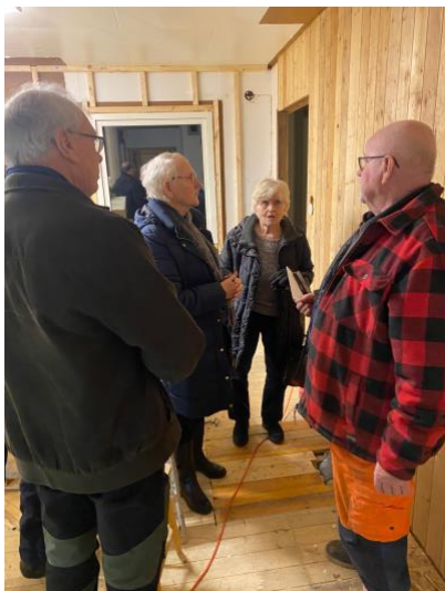
På månadens byggmöte deltog 20 personer och de hade möjlighet att gå runt på bygget och ställa frågor. Föreningen bjöd på byggfika.

Sevalla Hem- och Bygdegårdsförening Organisationsnummer: 878001-0115 sevallahemochbygdegard@gmail.com