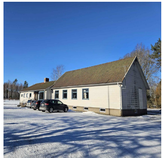
Bygdegården, vacker i vintersolen. 2024-02-15