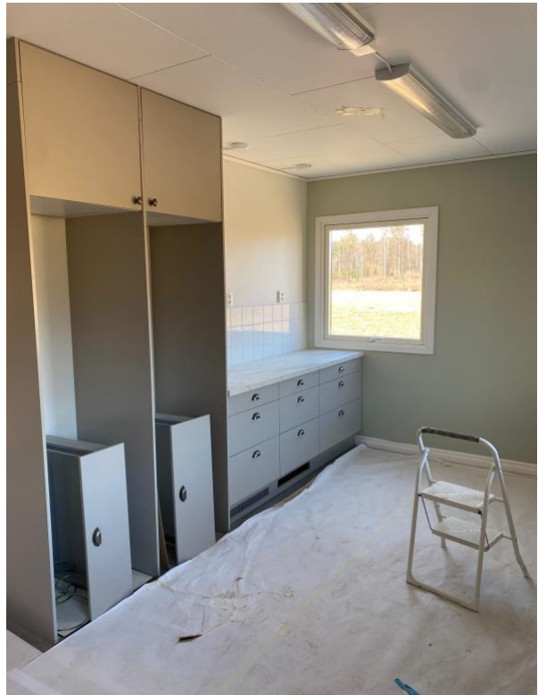
Köket väntar på vitvaror. 2024-03-07