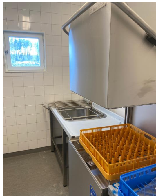
Diskmaskinen har monterats in. 2024-03-25