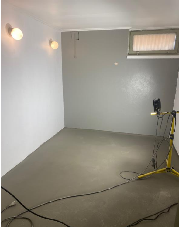
Relaxen håller på och får sig en rejäl uppfräschning. 2024-03-25